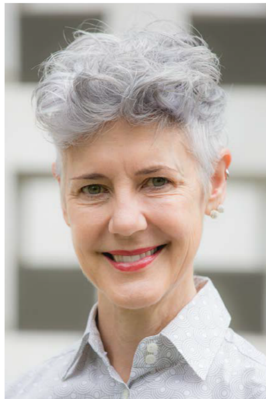
アストリッド・クライン