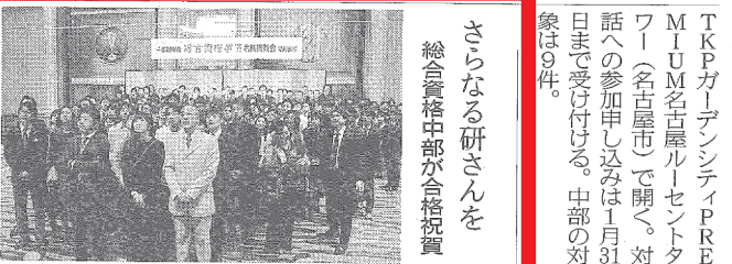
総合資格学院中部が合格祝賀

概要や今後の意気込みについて語った。 これは名古屋市中区栄1の旧御園座会館の建て替え事業「栄一丁目御園座共同ビル計画」として開発を進めてきた。事業主は積水ハウス、設計施工は鹿島が担当。2015年4月に工事が始まり、17年12月に竣工を迎えた。 説明の席で小笠原会長は「御園座を核に地域の活性化を目指す」とし、周辺も含めた点を紹介した。 「建設の具体的な内容に触れたい」と、隈氏は「RC二部S造は地下1階地上40階建て延べ約5万6130平方メートル。劇場、共同住宅、店舗、駐車場で構成する。