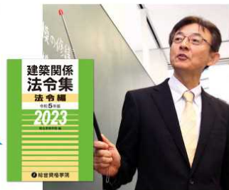
※ガイダンスは映像形式で実施されます。

年間販売数 日本一 ※紀伊國屋書店・丸善ジュンク堂書店・ TSUTAYA「建築関係法令集」発売において 2021年11月～2022年9月POSデータより