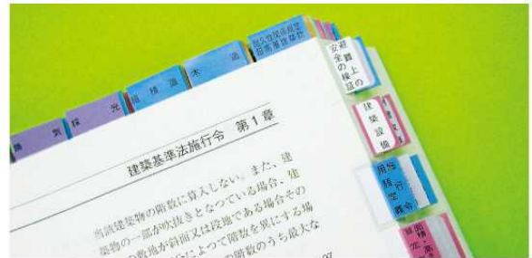
※学院出版の法令集をお持ちの方に限ります。